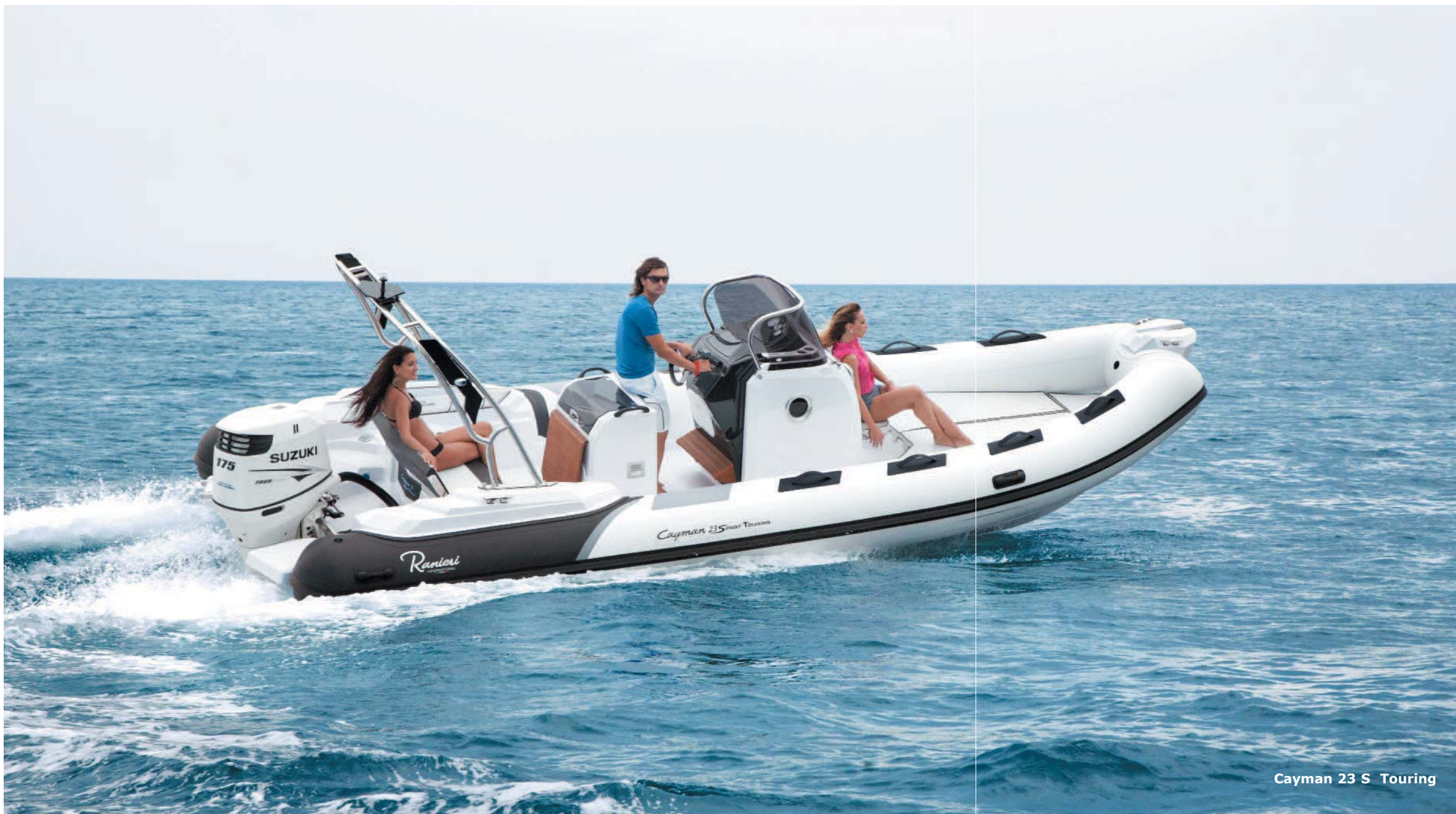
Cayman 23 S Touring

Cayman 23 Sport e Cayman 23 Sport Touring sono le due diverse versioni della 23: entrambe presentano lunghezza di 7,10 metri, larghezza 2,85 mt, 700 kg di peso, la motorizzazione prevista va da 100 a 250 HP, medesime sono, infine, le capacità dei serbatoi: da 205 litri per la benzina e 45 per quello dell'acqua.