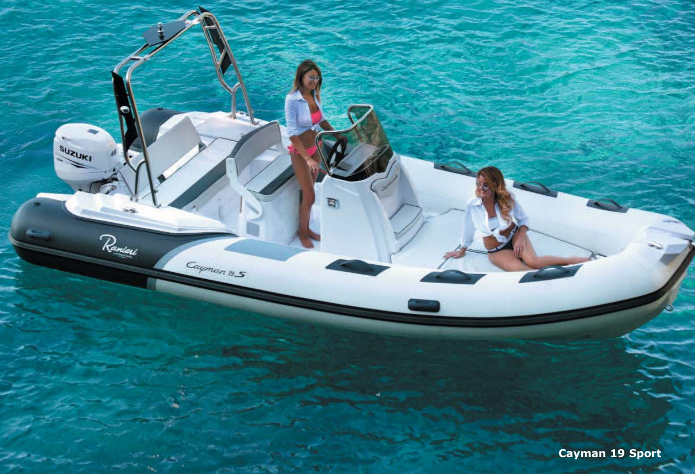
Cayman 19 Sport

In controtendenza rispetto alla crisi economica che si è delineata negli ultimi anni Ranieri International amplia con una nuovissima linea Rib la propria offerta commerciale e lo fa con imbarcazioni di prima classe, brillando ancora una volta per eleganza e performance.