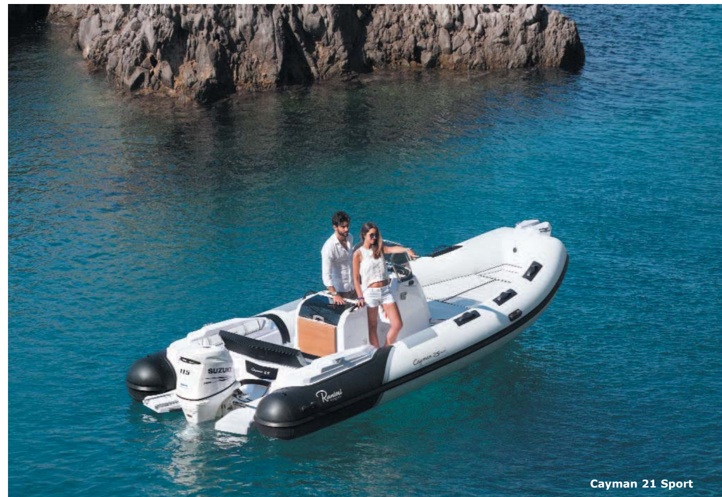
Cayman 21 Sport

Cayman 21 Sport , rispetto alla 19 cambia per lunghezza di 6,45 metri e per la potenza: da 70 a 175 HP. Ovviamente anche il peso varia come anche il serbatoio del carburante da ben 165 litri. Restano invece analoghe le dimensioni dei tubolari da 60 cm e la loro divisione in 5 compartimenti separati che garantiscono buona navigabilità e soprattutto governabilità anche in caso di qualche danno. Variegata e ricca di soluzioni le possibili finiture a piacere del cliente che vanno a completare dotazioni di serie già molto ben strutturate.